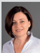
Eva Konzett Kommunikation / Verwaltung